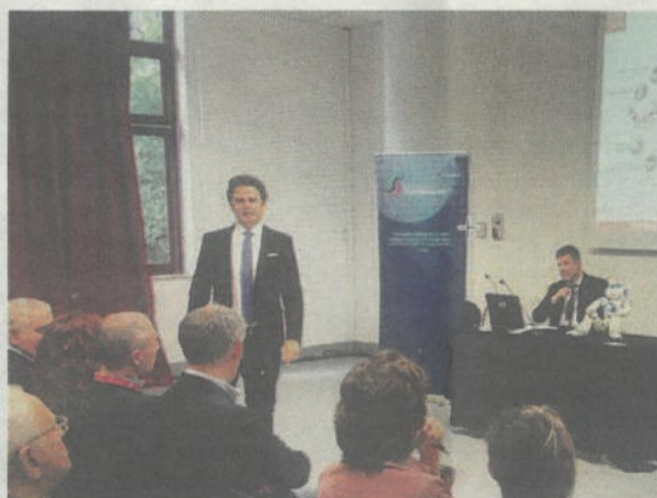
L'AZIENDA SUPPORTA LA DIFFUSIONE DI NUOVE COMPETENZE PER LA GESTIONE DEI PROGETTI