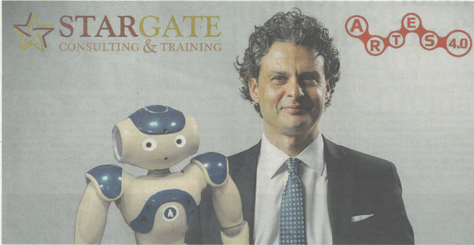
TECNOLOGIA, FORMAZIONE E SUPPORTO FINANZIARIO POSSONO CREARE UN CIRCOLO VIRTUOSO PER L'INNOVAZIONE

L l domani che la società attuale si appresta a vivere è sempre più improntato verso un mondo digitale e interconnesso. In questo scenario, le imprese che intendano rimanere competitive hanno un onere in più: adeguare le proprie strategie produttive in un'ottica di innovazione tecnologica. Un compito non scontato e certamente non facile da portare a termine in maniera brillante poiché la tecnologia, da sola, non basta per decretare la nuova alba di un'azienda. Per garantire che il giusto stimolo provenga anche dall'interno, è necessario investire anche nella formazione 4.0 in modo da favorire l'acquisizione di nuove competenze strategiche negli asset Industria 4.0 garantendo, così, al proprio personale gli strumenti adeguati per l'utilizzo di strumenti e tecnologie innovative. Ne