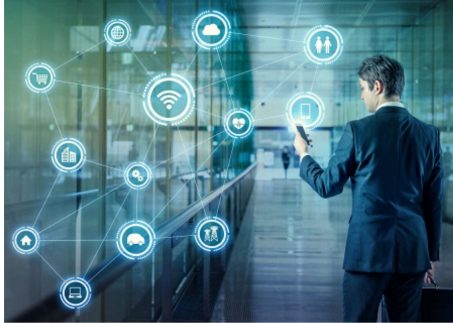
Innovation Manager Pmi