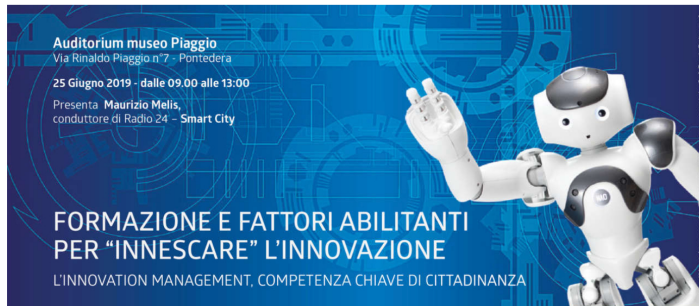
Innovation Management - l'evento a Pontedera (PI)

L'Innovation Management è la figura professionale cruciale per la crescita delle aziende. Le opportunità e le sfide affrontate nel convegno di Pontedera (Pisa)